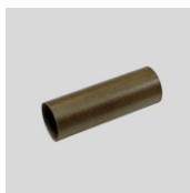
Obj. č. 4011 Izolační trubice