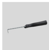
Obj. č. 7014 Zkušební háček