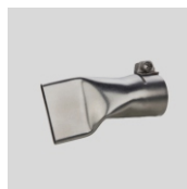
Obj. č. 4003 Přeplátovací tryska 40 mm