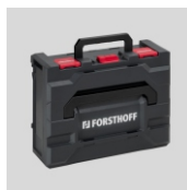
Obj. č. 7025 Přepravní kufr systém metaBOX