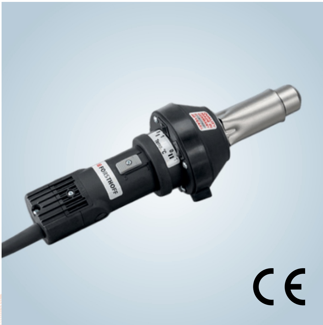
Ruční horkovzdušná svářečka Quick-L