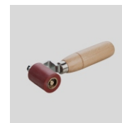
Obj. č. 6997 Přítlačný váleček 45 mm jednoramenný s ložisky