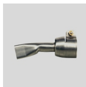
Obj. č. 4002.15 Přeplátovací tryska 20 mm / 15°