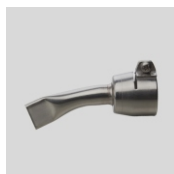
Obj. č. 4002 Přeplátovací tryska 20 mm