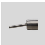
Obj. č. 4000 Základní tryska 5 mm