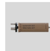
Obj. č. 2004 Topné tělísko 900W / 230V