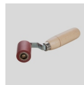
Obj. č. 6995 Přítlačný váleček 45 mm / 45° jednoramenný s ložisky