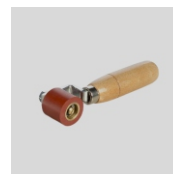
Obj. č. 6994 Přítlačný váleček 28 mm jednoramenný s ložisky