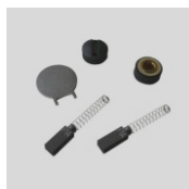
Obj. č. 9136 Náhradní uhlíky včetně klíče