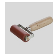
Obj. č. 6996 Přítlačný váleček 80 mm dvouramenný s ložisky